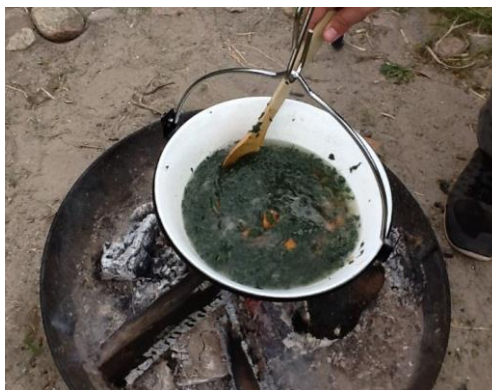
Mad over bål med egne krydderurter

Når børnene bliver nysgerrige på naturen og tilegner sig viden herom, kan det danne grundlag for varig interesse, respekt og ansvarlighed for natur og miljø, som de senere kan bruge i deres liv til gavn for vores klode. Det er så oplagt at arbejde bevidst med naturen, da det foruden viden og ansvarlighed også tilfører oplevelser der både indeholder overraskelser og spænding, og som hermed kan bidrage med livskvalitet i sig selv – også på længere sigt.